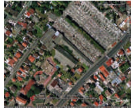
Situation de l'usine en vue rapprochée, 2007.

Tout au long de son activité, le CMMP a fait l'objet de nombreuses plaintes de riverains