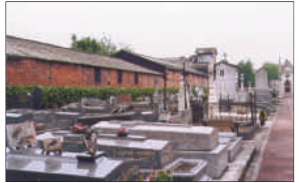
Les bâtiments de l'usine tels qu'ils sont visibles aujourd'hui.