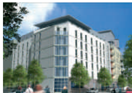
Architecte : ARTE-CHARPENTIER

* Pour une affectation du bien pendant 20 ans à une activité soumise à TVA.