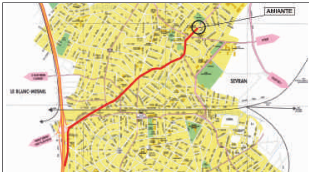
Situation de l'usine sur le plan actuel de la ville

Ces questions concernant les populations exposées professionnellement à l'amiante ont une acuité encore plus grande pour des riverains dont les expositions sont bien inférieures pour un grand nombre d'entre eux. Quels sont les effets délétères à redouter d'une information d'une large population sur une exposition ancienne à l'amiante ?